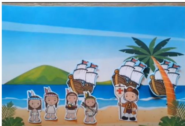
Figura 1. Captura de pantalla del video proyectado.

realizaba, cómo se vestía, etcétera” (p. 44). Sin embargo, en el caso observado no se profundizó en el abordaje de su contexto de uso y las características del pueblo mapuche.