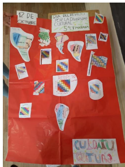
Figura 7. Afiche realizado por los estudiantes de 5 to grado. Fotografía Arabela Ponzio. Tomada el 12 de octubre de 2022.

En 5 to grado, luego del acto, la docente explicó de manera oral y escribió en el pizarrón algunas consignas que hacían referencia a: “¿quién descubrió América y que pasó con los pueblos originarios después de la llegada los españoles? ¿Por qué se llamaba a este día “Día de la Raza?, ¿por qué se lo cambió por el Día del Respeto a la Diversidad Cultural Americana?”. A continuación, repartió fotocopias de dos carillas, y los estudiantes reunidos en grupos se dispusieron a responderlas. Al finalizar, la docente les propuso armar una nube de palabras en un afiche representando todo lo que significa ese día. Las producciones de los estudiantes consistieron en banderas de Whipala, mapas de América y un árbol, y la elección de palabras como: diversidad, cultura, respeto, derechos, ley, aceptarnos (Figura 7).