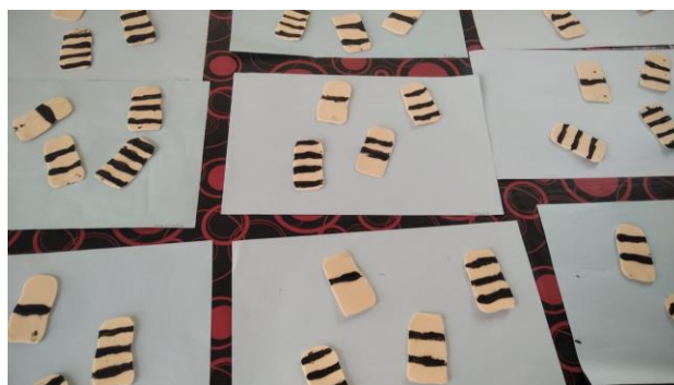
Figura 2. Fichas del juego “Allel-Kuzen” confeccionadas por los niños de Sala de 3. Tomada el 12 de octubre de 2022.

En la Sala de 4, la docente narró a los niños –que dejaron sus bancos y mesitas para sentarse en almohadones- la historia de Colón apoyada por una cinta fotográfica. Al finalizar el relato la docente les preguntó “¿está bien lo que hizo Colón al querer cambiar las creencias que tenían otras personas?” y los invitó a realizar un dibujo sobre lo que entendieron.