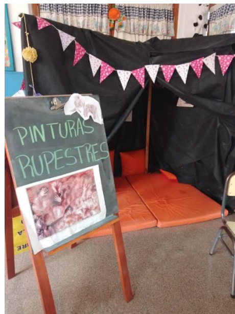
Figura 3: Ambientación de la Sala de 4. Tomada el 12 de octubre de 2022.

En este caso, se puede observar que el punto de partida vuelve a remitirse al proceso de expansión europea, centrándose en la figura de Colón. Ahora bien, en ese caso, la figura del héroe es cuestionada y se incluye dentro de las acciones de desestructuración del mundo indígena. En la segunda parte, al trabajar la docente sobre algunas características de las sociedades indígenas, lo hace de manera genérica sin describir a ningún pueblo de manera puntual, y utiliza para referirse a estos la categoría “nativos”. De esta manera no da cuenta de la multiplicidad de formas de organización social, económica, cultural de las sociedades previa a la conquista, ni de sus cambios y permanencias que experimentaron luego de este suceso. El recurso referido al arte rupestre, caracteriza las pinturas y grabados como los primeros rastros de vida de los antiguos (CNTV Infantil, 2016, 1m) y se detiene en mostrar algunas figuras de animales y la forma de ejecución por contorno. La única referencia espacial que menciona refiere a la presencia de petroglifos en el norte de Chile.