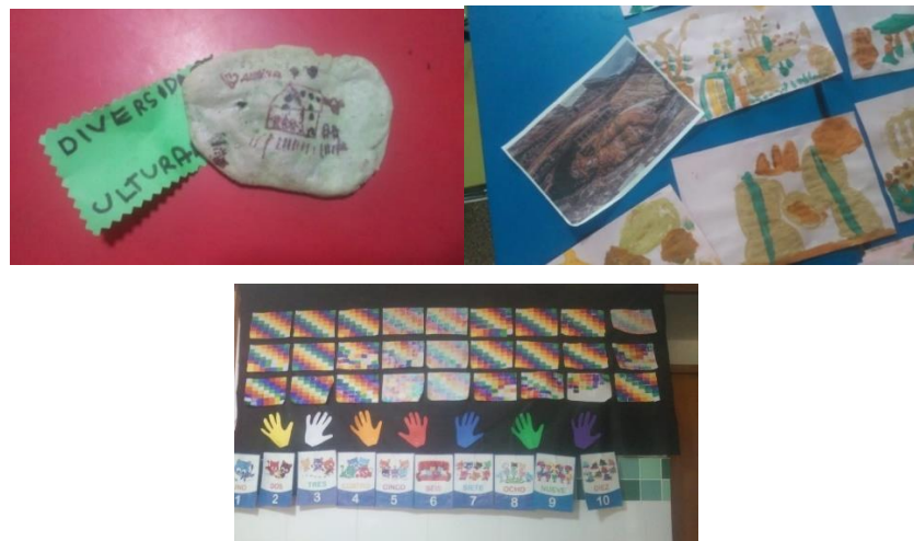
Figura 4a, b y c. Producciones de los estudiantes de Sala de 5. Tomada el 12 de octubre de 2022.