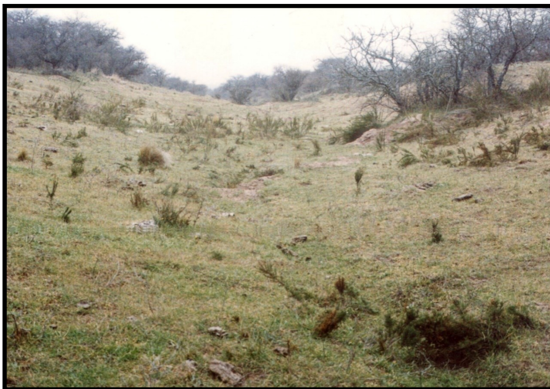
Figura 1: Aspecto actual de una rastrillada ubicada al norte de Santa Rosa (La Pampa).

Las rastrilladas principales recorrían centenares de kilómetros, teniendo en general un ancho superior a los 50 metros, conectando puntos distantes. Debido al constante tráfico de personas y ganado, fueron haciéndose más profundas, llegando a estar su centro hasta 2 metros más abajo que los bordes. En tanto que las secundarias tenían de 4 a 15 metros de ancho y transitaban distancias más reducidas, dentro del área de influencia de un cacicato. La profundidad de estas rastrilladas generalmente no superaba el metro. En varios casos de rastrilladas que aún son visibles, se observan estas características (Ver Fig. 1).