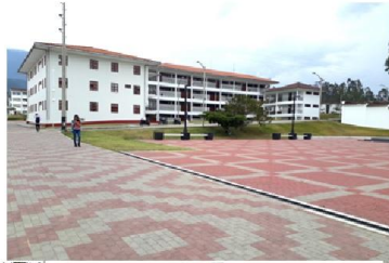
Primer Congreso Internacional de Arte Rupestre. Chachapoyas, Perú.