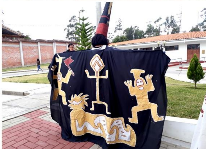
Universidad Nacional Toribio Rodríguez de Mendoza