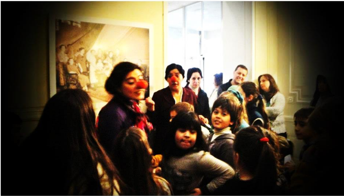
Figura 4. Fotografía de la visita teatral del día 12/07/12

Los personajes eran quienes invitaban al juego, al entretenimiento y al aprendizaje desde la ficción, utilizando la estrategia teatral con técnica clown para establecer un vínculo cotidiano con el público. Este recurso permitió romper con ciertas formalidades, tensiones de una visita tradicional. Se estableció una comunicación horizontal para el intercambio de ideas, sensaciones y dudas permitiendo de esta manera que el visitantes-participante construyera su posicionamiento en relación a las concepciones de patrimonios propuestas.