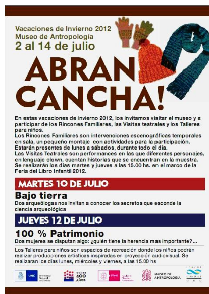
Figura 2. Flyer institucional de difusión de actividad

Para este simposio seleccionamos una experiencia de la actividad “Abran Cancha” Vacaciones en el Museo 2012 que se desarrolló en el mes de Julio de ese año, coincidiendo con la Feria Infantil “Busca el Libro que te busca...” en la cual participamos como institución.