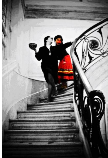
Figura 3. Fotografía de los personajes en escena

Para analizar esta visita teatral y cómo se relacionaron los ejes planteados (Conceptual, Pedagógico, Comunicacional) nos detendremos en cómo se han puesto en juego las variables del tiempo, espacio y sujetos.