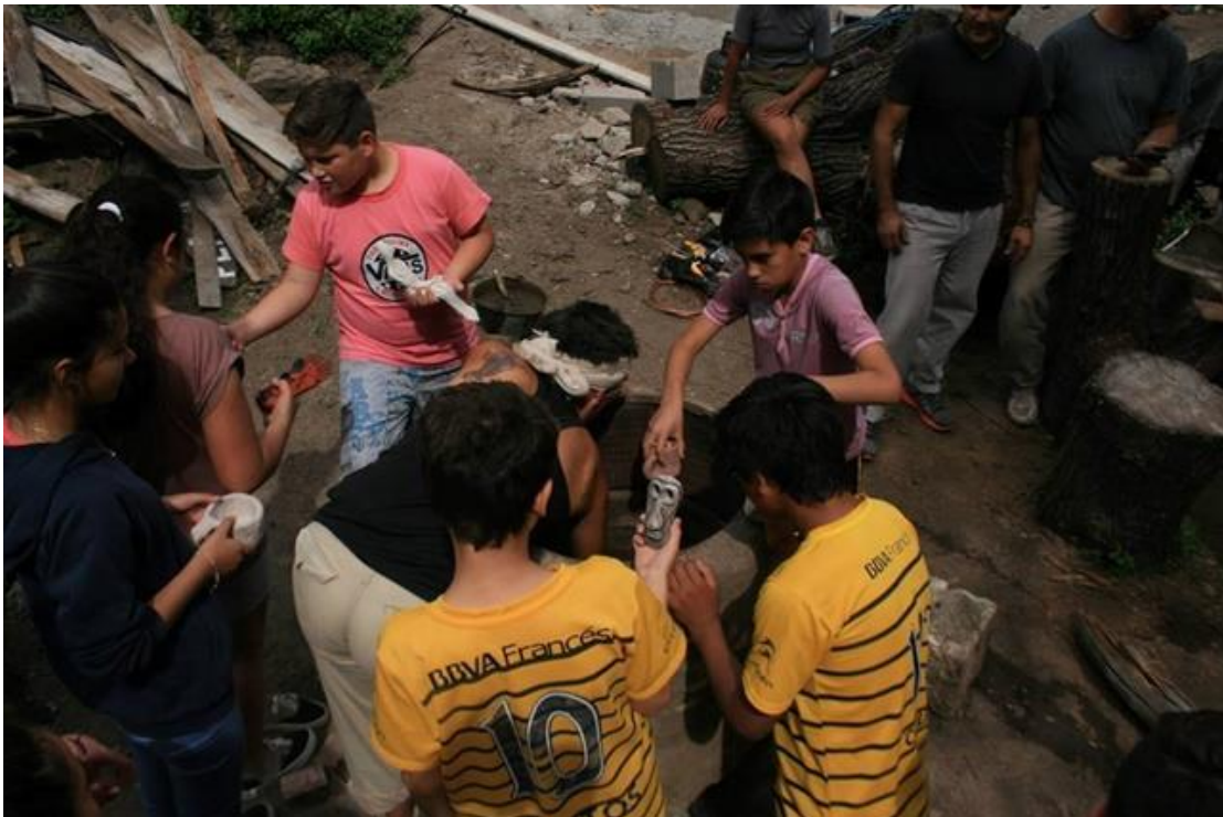
Fotografías 10-11: Talleres con estudiantes