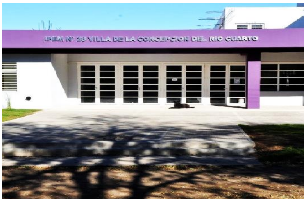
Figura 1. Frente del nuevo edificio del IPEM N° 28 “Villa de la Concepción del Río Cuarto”.2014

El nuevo establecimiento educativo cuenta con una superficie de 2800 m 2 . Además, posee un salón de usos Múltiples (SUM), biblioteca, talleres de audiovisual, radio, plástica, teatro y música. Tiene disposición de sanitarios, cantina, laboratorios, cocina comedor, en el cual los estudiantes acceden al programa de alimentación.