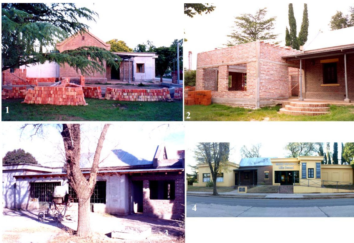
Fotografía 1. Inicios de construcción anexa a la Casa de la Estación del Ferrocarril. Fotografía 2. Construcción del edificio anexo a la Casa de la Estación, en el Complejo del Ferrocarril. Fotografía 3. Espacio destinado al Museo a partir de la Casa de la Estación del Ferrocarril y construcción anexa. Fotografía 4. Fachada actual del Museo MUHAM